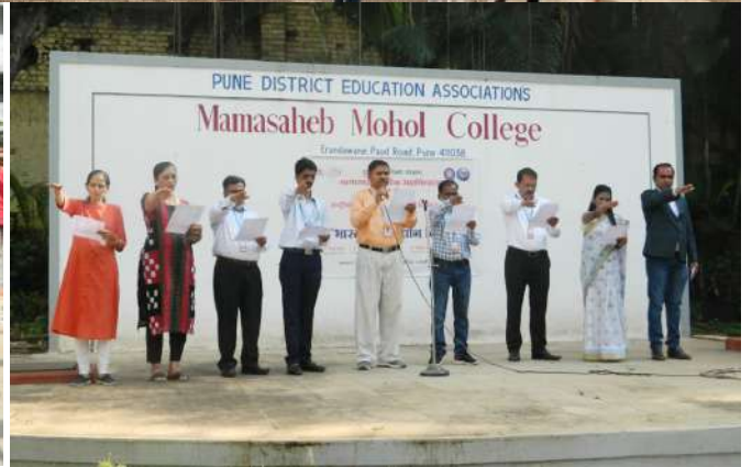
Indian Constitution Day