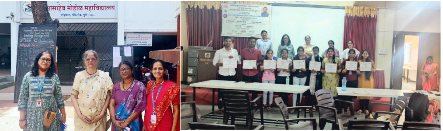
NSS University Level Workshop