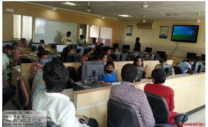
Add on course