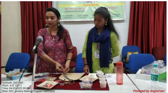
EDC and BSD - Jewellery Making Workshop