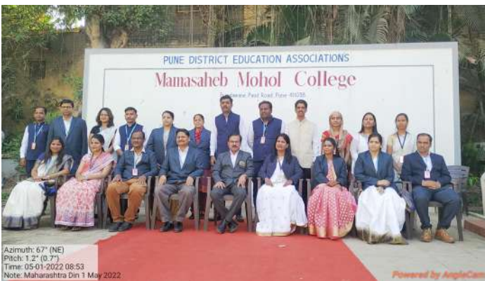
Add on Course Committee