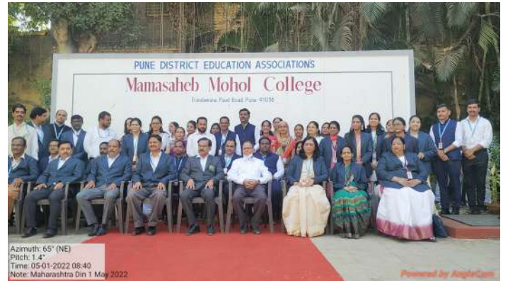
All Teaching and Non Teaching Staff