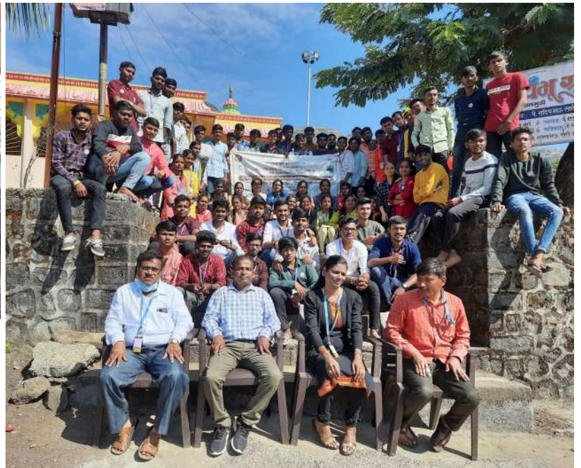
NSS Bhalgudi Special Camp