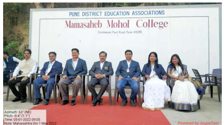
Parent Teacher Association