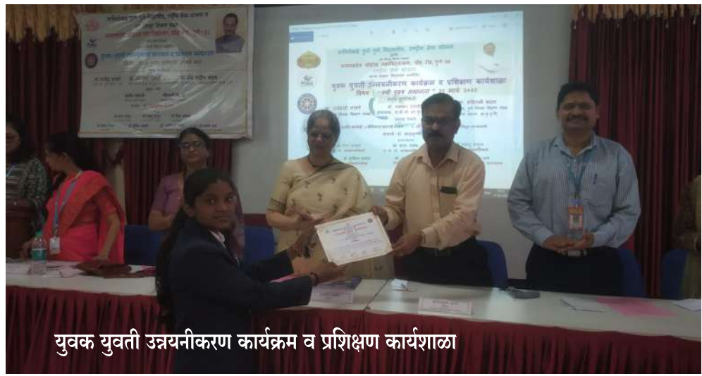
युवक युवती उन्नयनीकरण कार्यक्रम व प्रशिक्षण कार्यशाळा