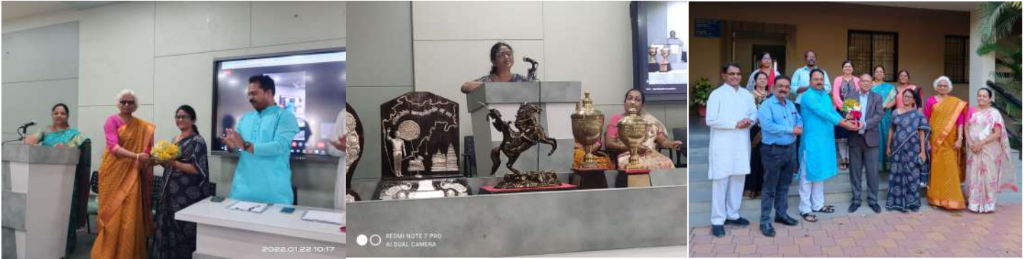
मराठी भाषा गौरव दिवस