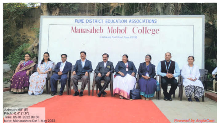
Life Long Learning and extension