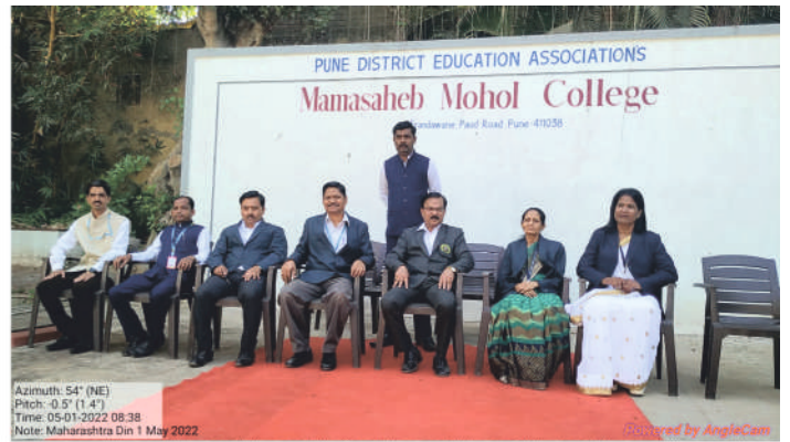
UGC Research Committee