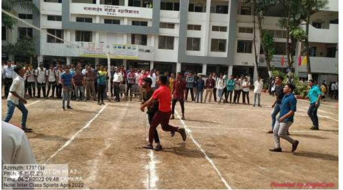
Inter Class Sports competitions