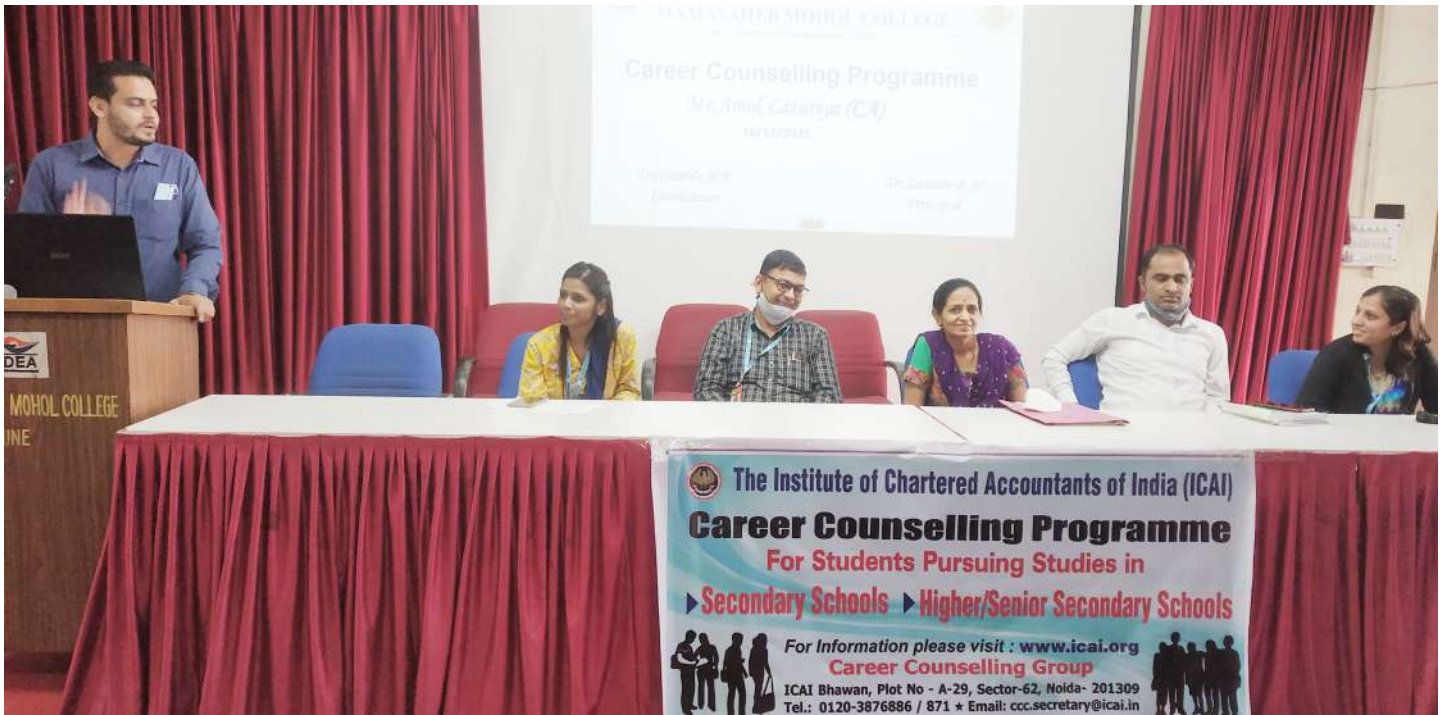
Career Counselling Program organised by ICAI