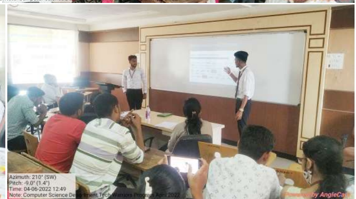
Anti-Ragging Cell & Student Development Board : Tech Warriors Program 2022